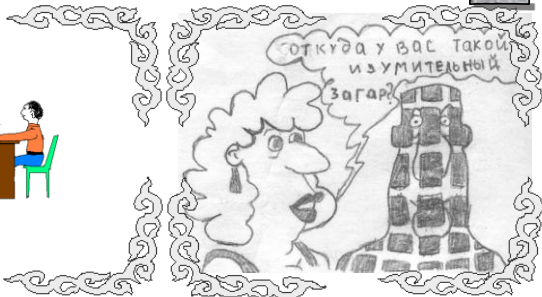
Безносилова Женья, 6А