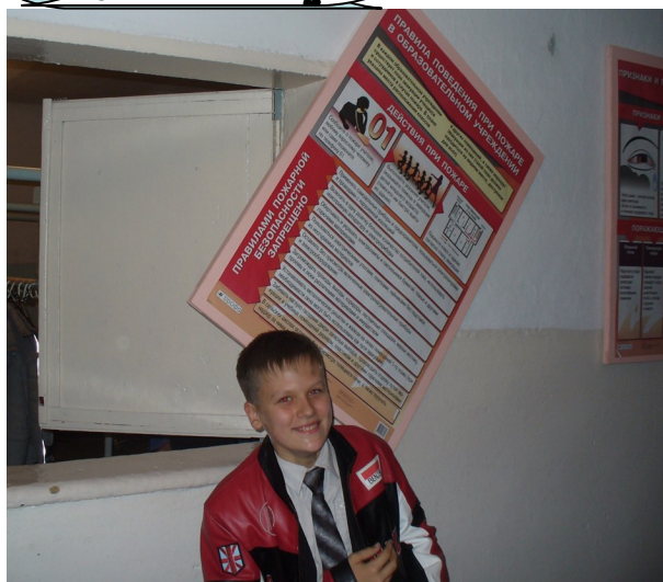
Правила пожарной безопасности, или разнести раздевалку за 10 секунд